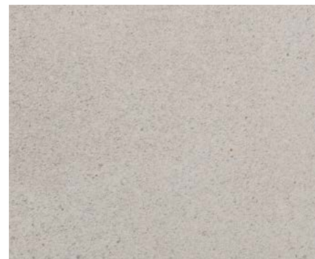
CÉRAMIQUE DE SALLE DE BAIN 12 X 24