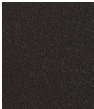
ARMOIRES DU BAS CUISINE (CHARBON DOLOMITE)