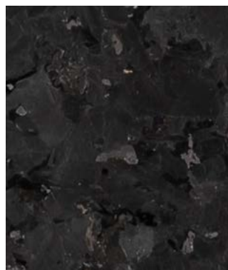
COMPTOIR CUISINE (GRANIT NOIR CAMBRIAN)