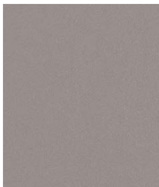
ARMOIRES DU HAUT CUISINE (AU PETIT MATIN)