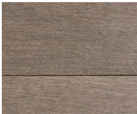
PLANCHER (MERISIER INOX PRO)