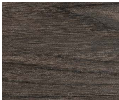
VANITÉ DE SALLE DE BAIN (TÊTE-À-TÊTE)