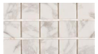
DOSSERET DE CUISINE (STATUARIO MILLA)