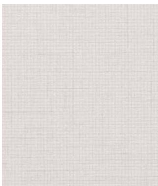
ARMOIRES DU HAUT CUISINE (CANVAS CALICO)