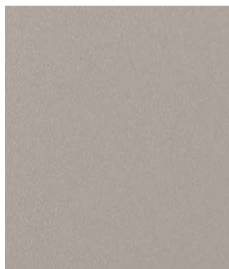
ARMOIRES DU BAS CUISINE (GRIS CANADIEN DOLOMITE)