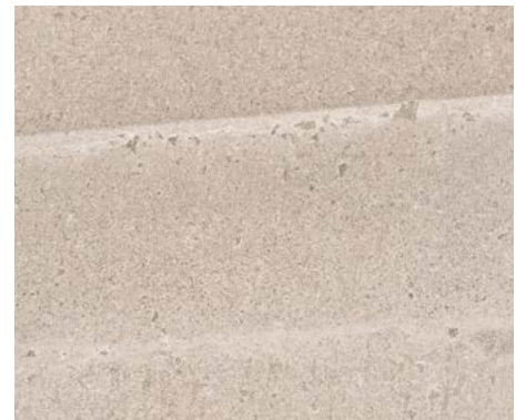
CÉRAMIQUE DE SALLE DE BAIN 12 X 24