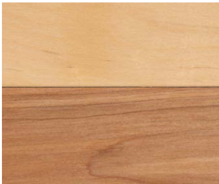
PLANCHER (MERISIER NATURAL-EL PRO)