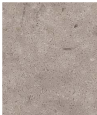
COMPTOIR CUISINE (NOBLE CONCRETE GREY)