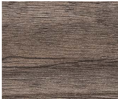
VANITÉ DE SALLE DE BAIN (CHASSEUR D'ÉTOILES)